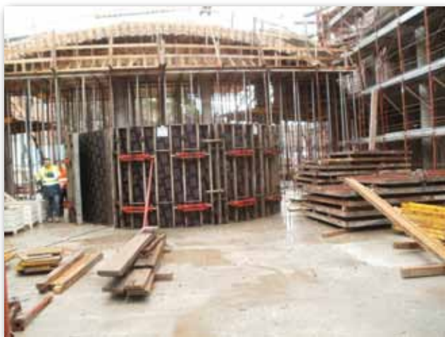
Foto n° 6 - Cassero per il campanile e, sullo sfondo, il pronao