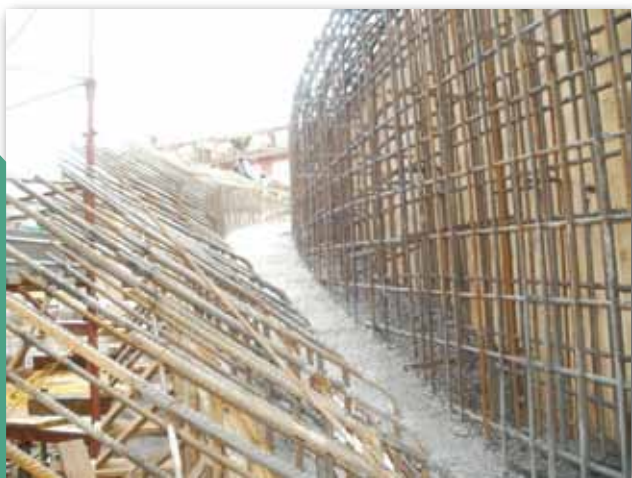
Foto n° 7 - Armatura della trave di coronamento del pronao

Concludo l'argomento, per non annoiarvi, con altre due curiosità.