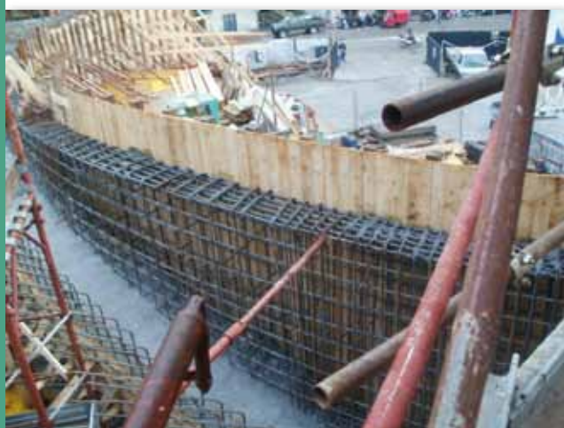
Foto n° 4 - Ferri e staffe della trave di coronamento del pronao: ingresso della Chiesa