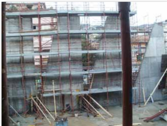
Foto n° 5 - Vele in c.a. viste dall'interno dell'aula prima della completa realizzazione delle stesse (vedi foto 1)

Regio Decreto Legge 16 nov. 1939 – XV n. 2229 pubblicato sulla Gazzetta Ufficiale n° 92 del 18 aprile 1940 dove VITTORIO EMANUELE III per grazia di Dio e per volontà della Nazione Re d'Italia e d'Albania e Imperatore d'Etiopia decretava appunto le Norme per l'esecuzione delle opere in conglomerato cementizio ed armato.